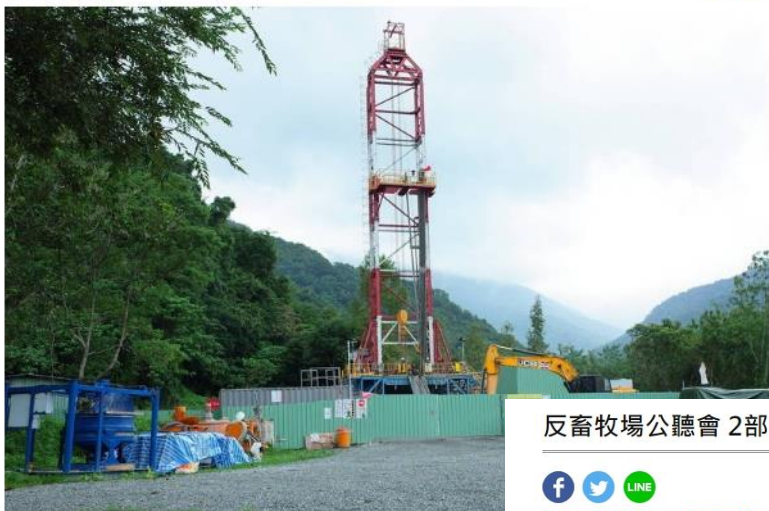
地熱開發商瑞典倍達羅得公司6月下旬起，在萬榮鄉紅葉段912-1地號引發居民反彈。